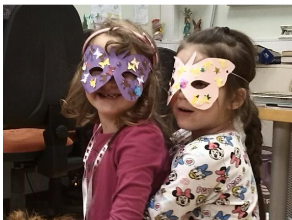
Fotografija 24: Na februarjski pravljичni urici smo izdelovali pustne maske.