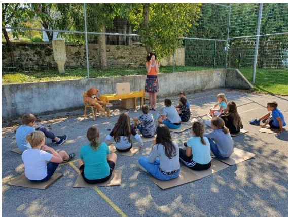
Fotografija 22: Veselo v novo šolsko leto v podružnični šoli na Bučki