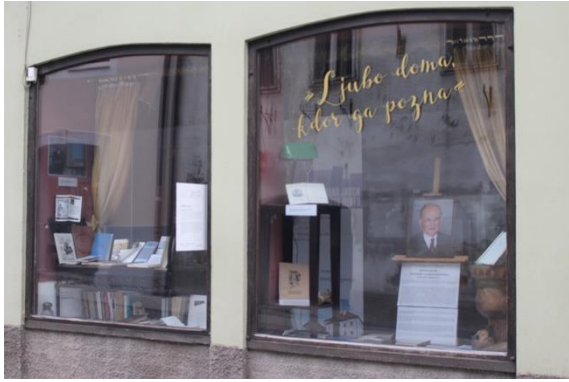
Fotografija 31: Razstava o novomeškem rojaku diplomatu in publicistu Bogdanu Osolniku ob stoletnici njegovega rojstva v izložbah nedeljujočega lokala v mestnem jedru Novega mesta