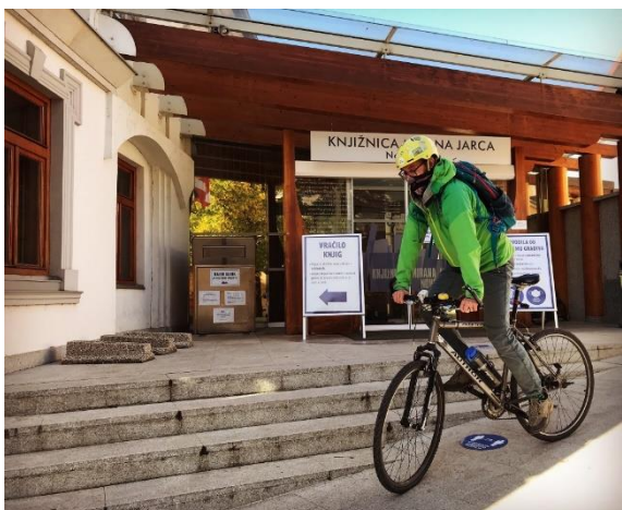
Fotografija 5: Storitev Bi knjigo na biciklu