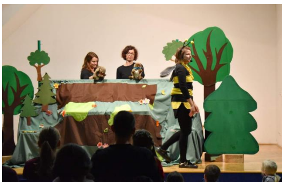
Fotografija 7: Lutkovna igrlica »Kjer se prepirata dva, ...«