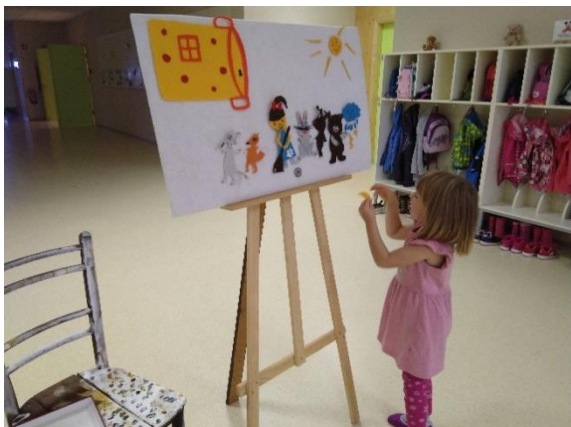
Fotografija 26: Teden otroka v Vrtcu Žužemberk. Tudi otroci so se poskusili v pripovedovanju.