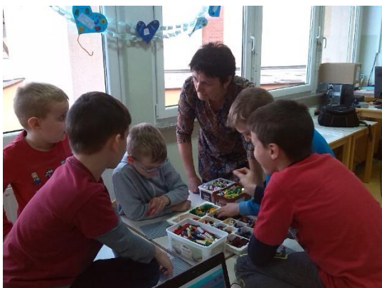
Fotografija 25: Lego delavnica – OŠ Dvor