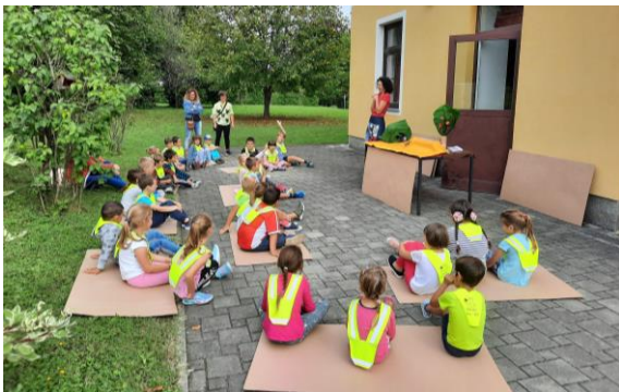
Fotografija 21: Veselo v novo šolsko leto za prve razrede OŠ F. M. Škocjan