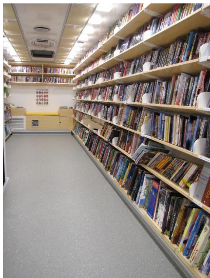
Fotografija 10: Notranjost bibliobusa