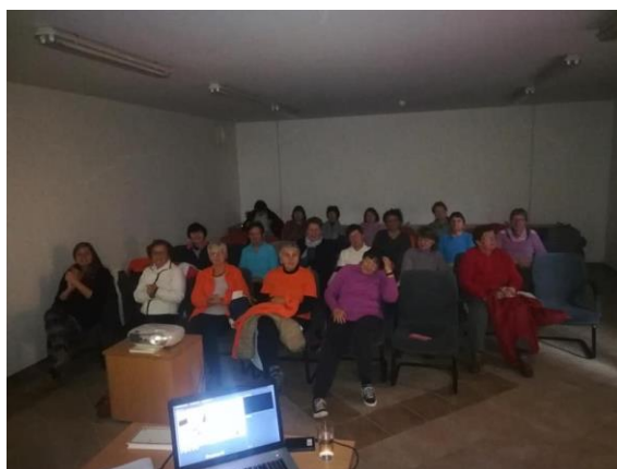
Fotografiji 16 in 17: Petkovi dopoldnevi so bili namenjeni srečanjem Orto kluba. Čeprav je bilo petkov bolj malo, smo v sklopu kluba pripravili različna predavanja, čajanke (prebiranje pesmi Toneta Pavčka, Ivana Minattija ...), potopise (Čudoviti svet morskih globin, potopisno predavanje Tajaska&Šrilanka, Maroko) ...