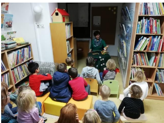
Fotografija 12: Knjižničarka pripoveduje otrokom pravljico z naslovom »Midva sva prijatelja«.