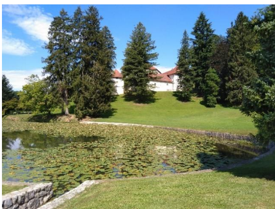
Fotografiji 27 in 28: Strokovna ekskurzija bralnega kluba Medobčinskega društva slepih in slabovidnih Novo mesto na grad Strmol.