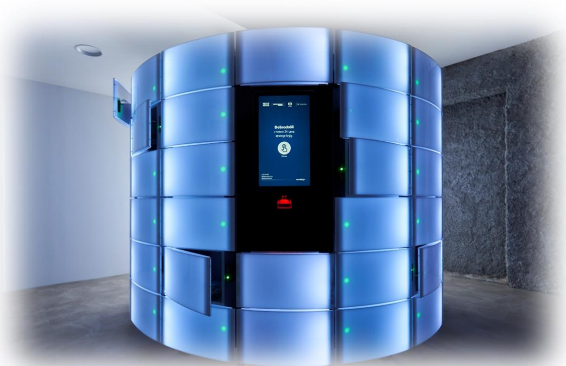
Slika 1: Pametna omara oziroma knjigomat za 24-urno izposajo naročenega knjižnega gradiva

V knjižnici je bilo konec lanskega leta skupaj zaposlenih 46 delavcev. Mestna občina Novo mesto je zagotavljala sredstva za 35 zaposlenih, šest zaposlenih so financirale občine, pogodbene partnerice, dva javna delavca so subvencionirali na Zavodu za zaposlovanje RS, plače dveh zaposlenih pa je krilo Ministrstvo za kulturo. V okviru koordinacije tematskega leta je knjižnica v letu 2020 zaposlila eno osebo.