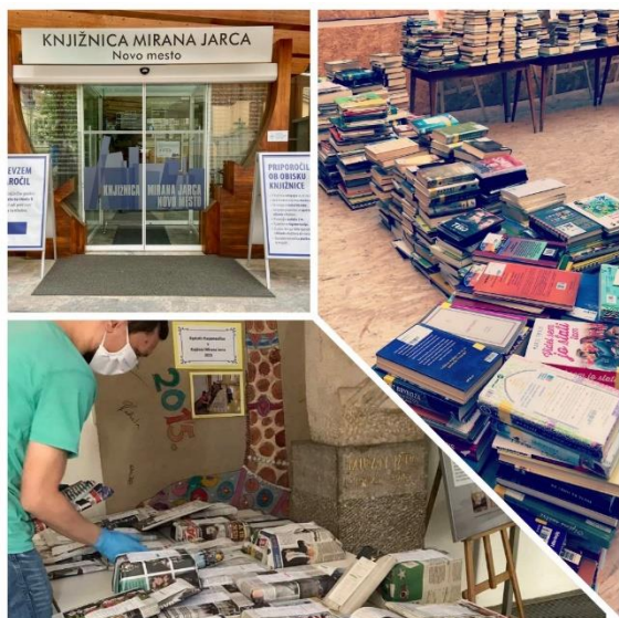
Slike 1–3: Upoštevanje varnostnih ukrepov med epidemijo

Predvsem pa smo zaposleni z uporabniki in s knjižničnim gradivom ravnali odgovorno in previdno ter v skladu s priporočili NIJZ za knjižnice.