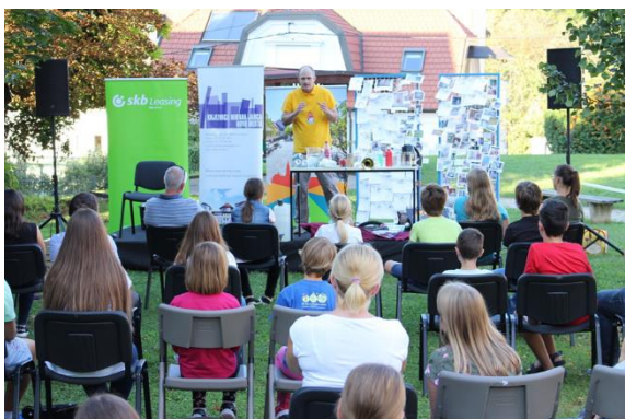
Fotografija 6: Zaključna prireditev Poletni pustolovci