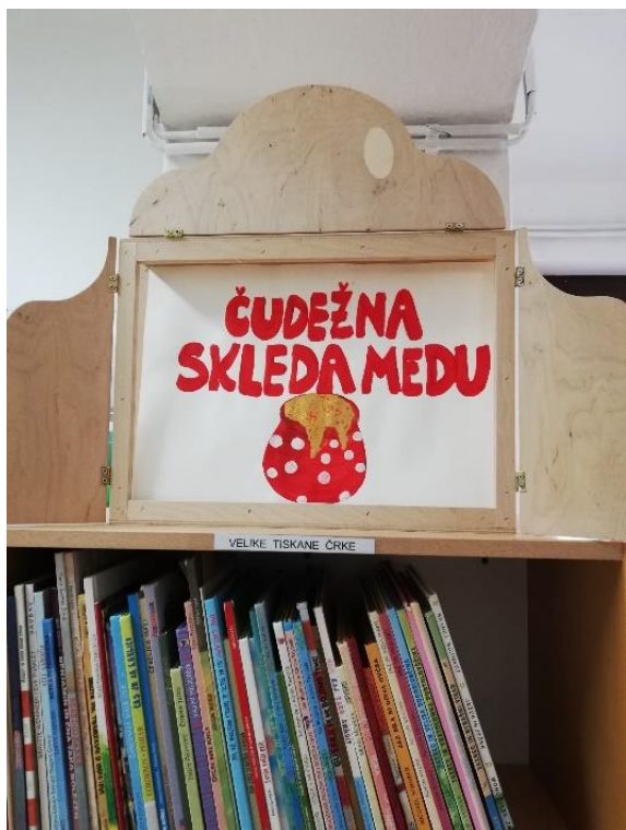
Fotografija 14: Pravljica »Čudežna skleda medu«, s katero je knjižničarka obiskala otroke v vrtcu Gumbek.