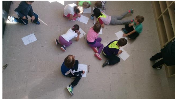
Fotografiji 18 in 19: Sodelovanje z otroki in vzgojiteljicami iz Vrtca Čbelica Šentjernej je res nekaj posebnega.