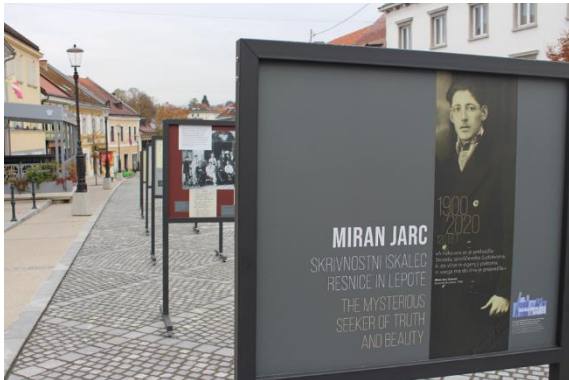
Fotografija 30: Razstava ob 120. obletnici rojstva pesnika Mirana Jarca na Glavnem trgu v Novem mestu

V sklopu praznovanja 100. obletnice novomeške pomladi smo v knjižnici izpostavili okroglo obletnico rojstva pesnika, dramatika in pisatelja Mirana Jarca (1900–1942), po katerem se imenuje novomeška knjižnica vse od leta 1953. Z namenom, da Novomeščanom predstavimo življenje ter bogato rokopisno in ostalo pesnikovo zapuščino, hranjeno v Posebnih zbirkah Boga Komelja, smo v Domoznanskem oddelku pripravili pregledno premično razstavo »Miran Jarc – skrivnostni iskalec resnice in lepote«, ki je bila postavljena na različnih prizoriščih v Novem mestu ter gostovala v pesnikovem rojstnem kraju, v Črnomlju. Razširjena razstava »Miran Jarc in novomeška pomlad« je bila predvidena tudi za gostovanje na Dunaju v okviru projekta Knjigotapljenje, a zaradi epidemioloških razmer ni bila realizirana. Poleg razstave smo pripravili spletno predavanje »Miran Jarc: A neko uro se je prebudila Beseda«, ki je bilo predvajano tudi na spletnem Slovenskem knjižnem sejmu, literarni sprehod po poteh novomeške pomladi ter prispevek o Miranu Jarcu v glasilu MO NM. Dokler je to dopuščala epidemiološka situacija, smo izvedli nekaj predavanj o Miranu Jarcu in novomeški pomladi za gimnazijce ter ostale zaključene skupine. Razstava in dogodki so bili izjemno dobro sprejeti in obiskani.