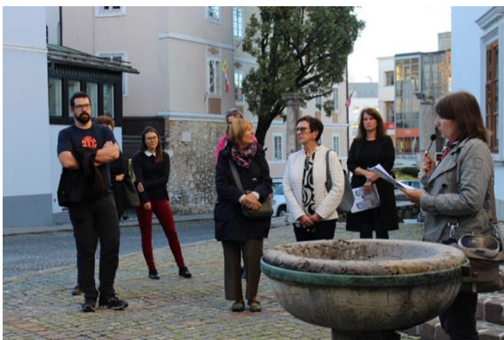
Fotografija 29: Literarni sprehod »Po sledih novomeške pomladi«, eden redkih dogodkov »v živo« v letu 2020