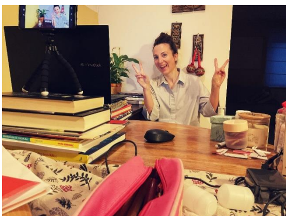
Fotografija 8: Priprava prispevkov za lokalno televizijo – »domač snemalni studio«