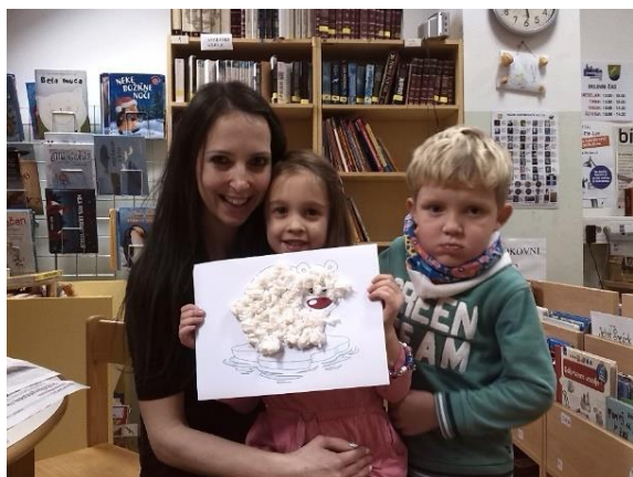
Fotografija 23: Na januarski pravljичni urici smo izdelali polarnega medvedka.