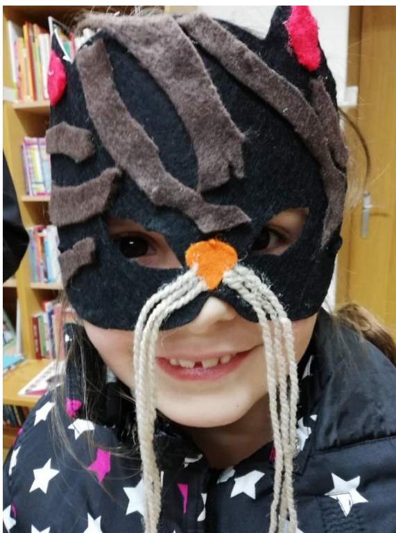
Fotografija 13: Izdelovanju pustnih mask v mesecu februarju