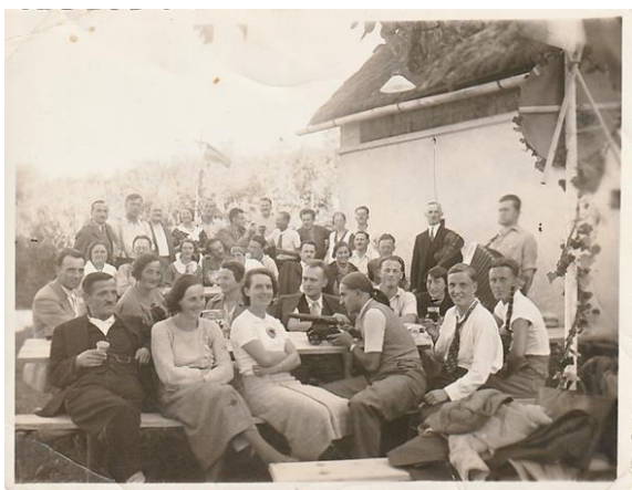
Slika 45: Vesela družba na Trški gori leta 1935. Fotografija, objavljena v digitalni zbirki »Trška gora – deželica sonca in grozdja« (kamra.si), je pridobljena iz zasebnega arhiva nekdanjih Trškogorcev.