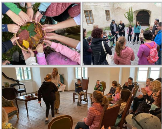
Slika 4: Zaključna prireditev Družinskega bralnega kluba