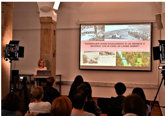
Slika 46: Predstavitev posebnih zbirk, njihove dostopnosti ter nove spletne aplikacije za dostop do zbirke starih razglednic na delovnem srečanju slovenskih domoznancev v Knjižnici Ivana Potrča Ptuj, junij 2022