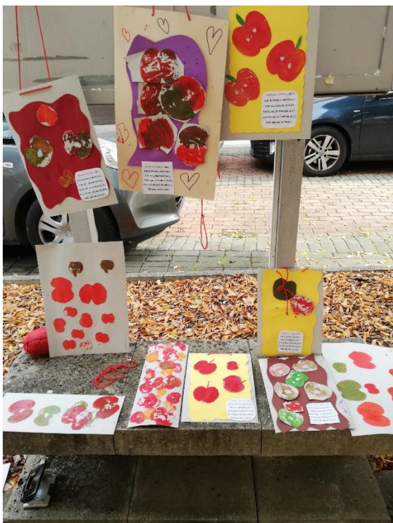
Slika 12: Ustvarjalna delavnica ob prazniku topliškega jabolka: odtisi jabolok