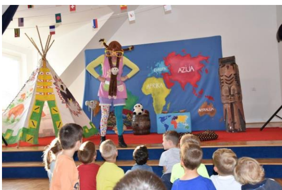
Slika 32: V tednu otroka smo s Piko potovali po svetu