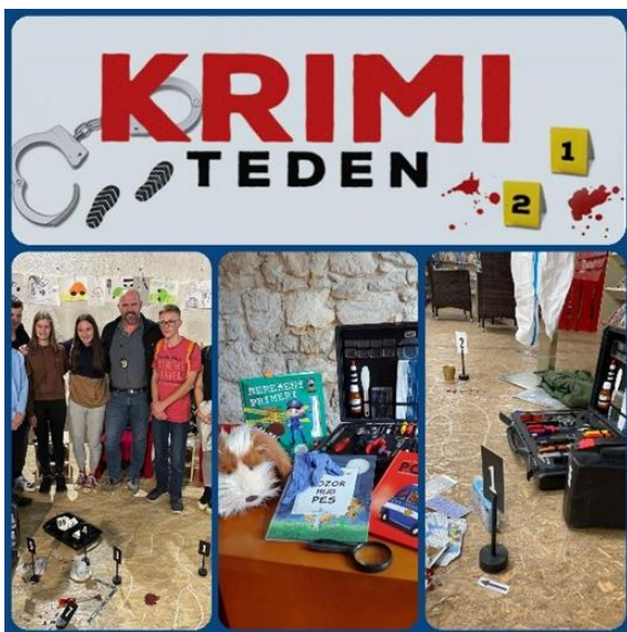
Slika 1: Krimi teden v knjižnici