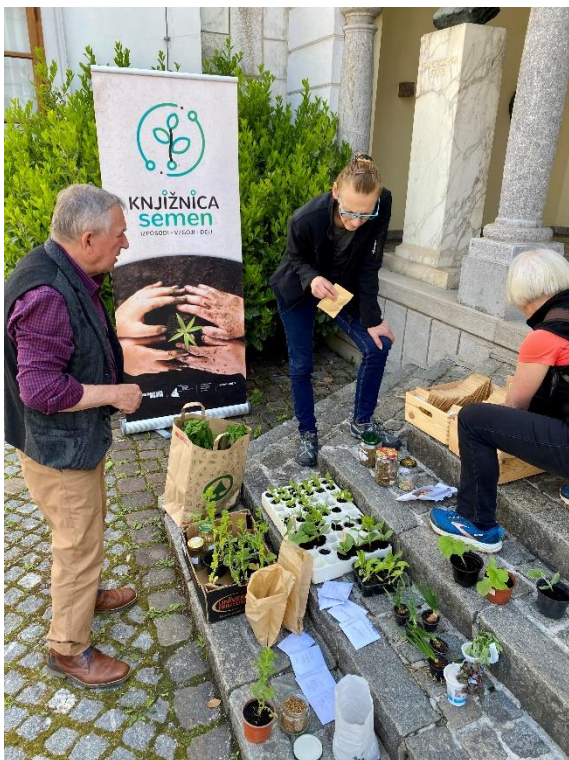
Slika 54: Izmenjava domačih sadik in semen pred Knjižnico Mirana Jarca Novo mesto, oktober 2022