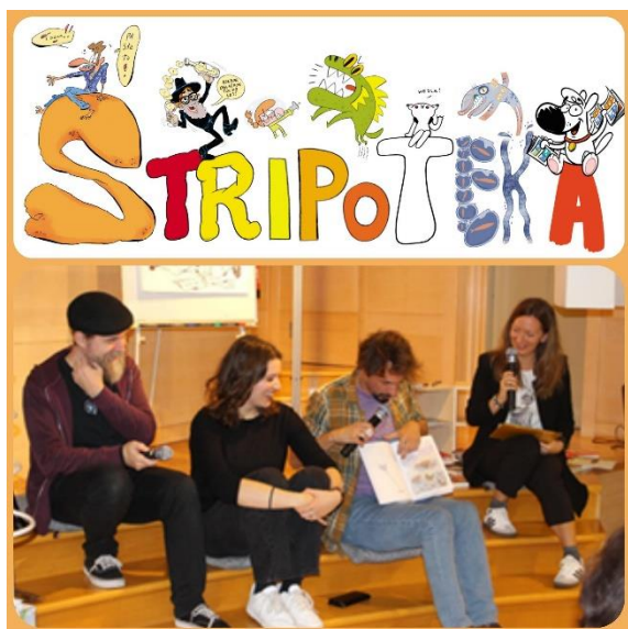
Slika 3: Otvoritev Stripoteke