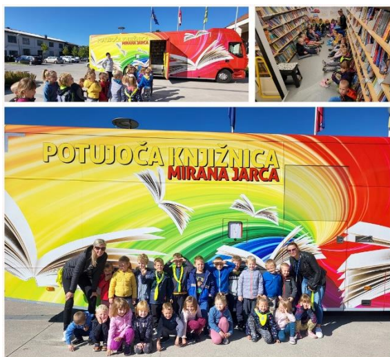
Slika 20: Dejavnosti ob tednu otroka