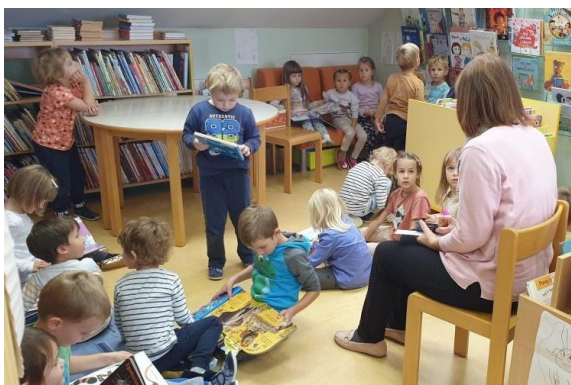
Slika 30: Vrtec na obisku: najmlajši ob listanju pravljic radi prisluhnejo pravljici