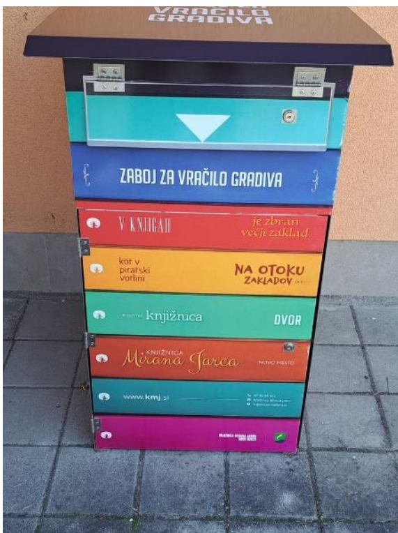
Slika 34: Nabiralnik za vračanje gradiva