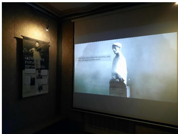
Slika 44: Spominska soba Mirana Jarca v njegovi rojstni hiši v Črnomlju, odprta 14. 12. 2022. V njej je predstavljeno gradivo iz pesnikove zapuščine, hranjene v novomeški knjižnici.

knjižnici Ivan Goran Kovačić Karlovcu in v Slovenskem domu v Zagrebu, predavanje o pesniku in njegovi zapuščini, hranjeni v novomeški knjižnici, v Mestni muzejski zbirki Črnomelj, soavtorstvo spominske sobe Mirana Jarca v njegovi rojstni hiši v Črnomlju z ZRC SAZU ter priprava prispevkov o Miranu Jarcu za objavo v monografiji Bela krajina za radovedneže in v periodičnih publikacijah. Ime pesnika Mirana Jarca postaja z različnimi in rednimi oblikami predstavitve njegovega življenja in dela ter izjemno dragocene in obsežne zapuščine vse bolj prepoznavno ne le v lokalnem in vseslovenskem prostoru, temveč tudi v mednarodnem okolju.