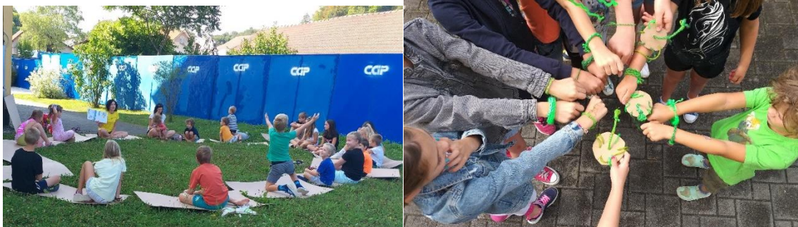
Sliki 17 in 28: Avgustovske bralno-ustvarjalne delavnice Mavrica v nas