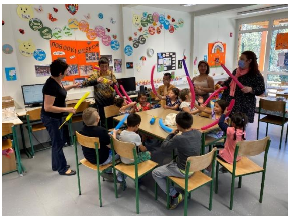
Slika 37: Prvo srečanje z romskimi otroki v prostorih Večnamenskega romskega centra Novo mesto