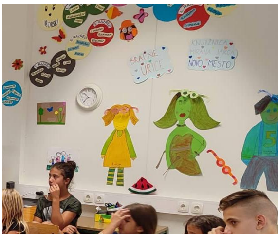
Slika 39: Del stene, ki jo romski otroci opremijo z izdelki, nastalimi v okviru srečanj oz. bralnih uric s knjigo