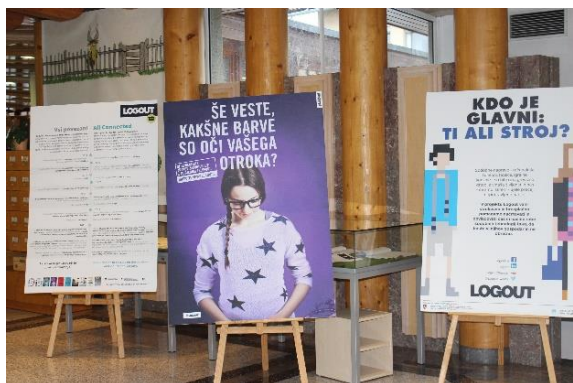
Slika 51: SOS točka – Skupaj Osvojimo Splet