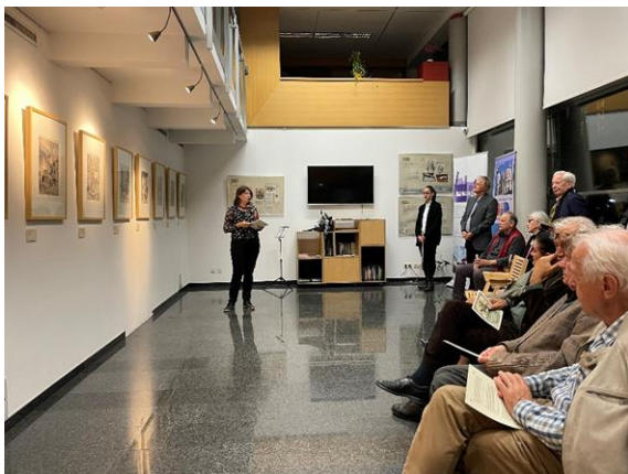
Slika 43: Odprtje razstave Martin Krpan na Dunaju, v Slovenskem kulturnem centru Korotan, 18. 10. 2022

Decembra smo z gradivom iz knjižnice in posebnih zbirk pripravili tudi digitalno zbirko z naslovom »Fran Levstik, slovenski pesnik, pisatelj, časnikar in jezikoslovec« na spletnem portalu Kamra. Hkrati pa smo skozi leto na portalu Obrazi slovenskih pokrajin dopolnjevali vsa biografska gesla, ki so povezana s Franom Levstikom.