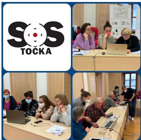
Slika 2: SOS točka z Digitalnim torkom