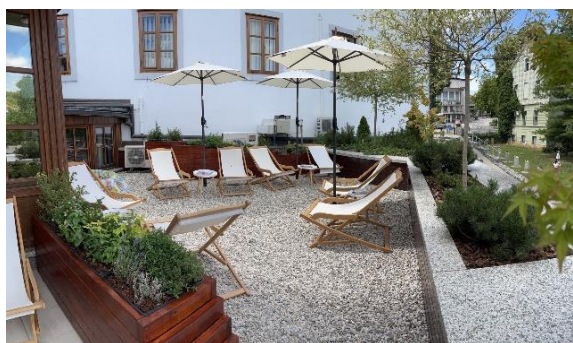
Slika 52: Knjižnična plaža

Poleti smo na terasi knjižnice uredili čisto pravo kamnito plažo z ležalniki, senčniki ter mizicami in stoli, manjkal ni niti bazenček. Za prijetnejše počutje smo zasaditvi dreves in grmičevja na terasi dodali visoko gredo, od koder se širijo arome zdravilnih zelišč in dišavnic. Tam je svoj prostor našla tudi Igrubežnica, namenjena izmenjavi rabljenih iger in igrač po sistemu »prinesi, česar ne potrebuješ, in vzemi, kar ti je všeč«.