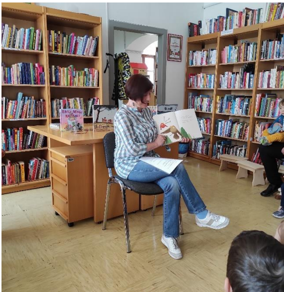
Slika 8: Knjižničarka otrokom iz vrtca Gumbek pripoveduje pravljico Ptiček in kletvica