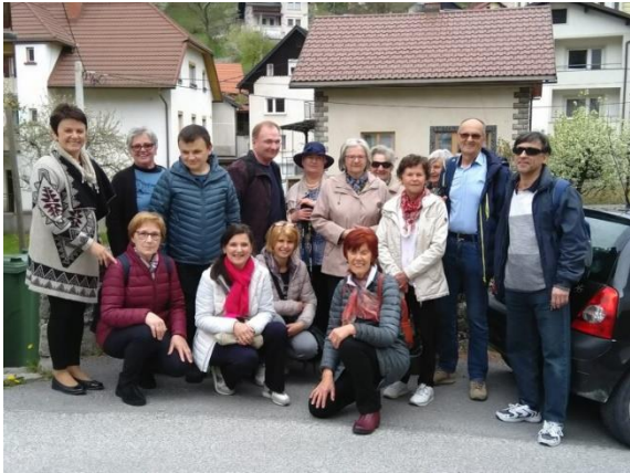
Slika 35: Strokovna ekskurzija bralnega krožka MDSS Novo mesto s spremljevalci – Idrija