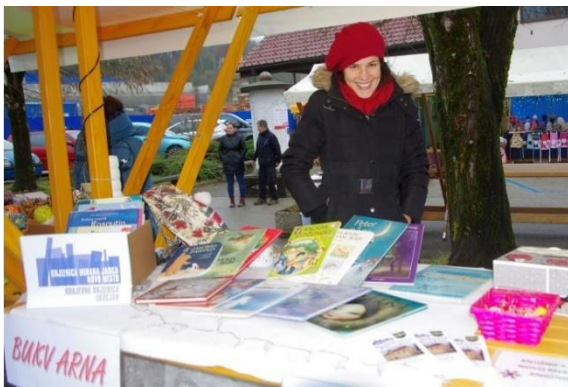
Slika 26: Stojnica na Miklavževem sejmu