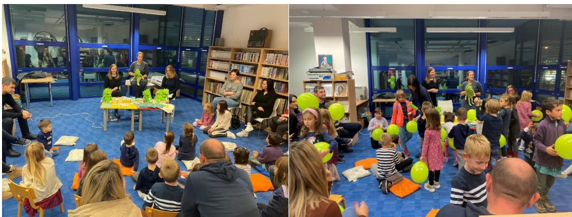
Sliki 40 in 41: Predstavitve slikanice z dogodivščinami malega Ginga s strokovno logopedsko podlago ob zaključku jezikovnih pravljčnih srečanj »Slovuric«