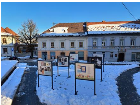
Slika 47: Razstava »Severin Šali – pesnik, zaljubljen v življenje« na ploščadi nasproti hiše na Rozmanovi ulici v Novem mestu, v kateri je pesnik živel in ustvarjal.