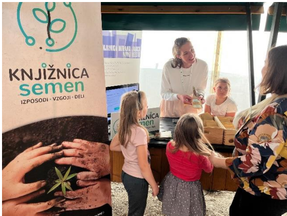
Slika 53: Knjižnica semen na 26. Gregorjevem sejmu v Novem mestu, marec 2022