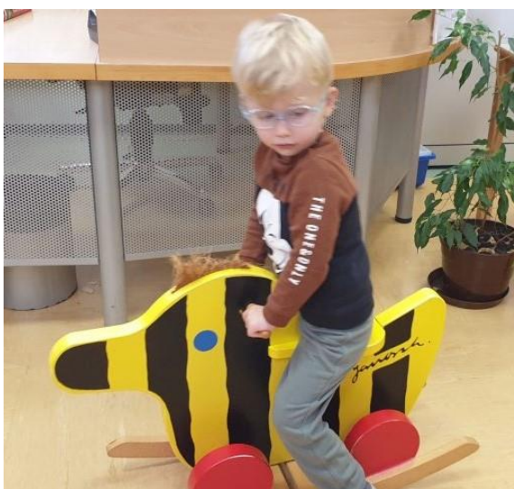
Slika 31: Najljubše igralo vrtčevskih otrok