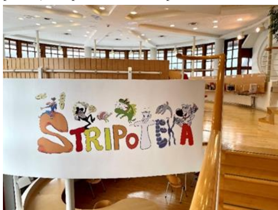
Slika 49: Likovna oprema Stripoteke