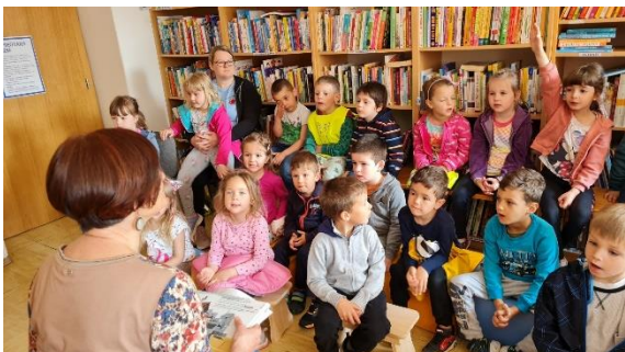
Slika 9: Skupina Medvedki iz vrtca Gumbek je z zanimanjem prisluhnila pravljici Kit v nevihti