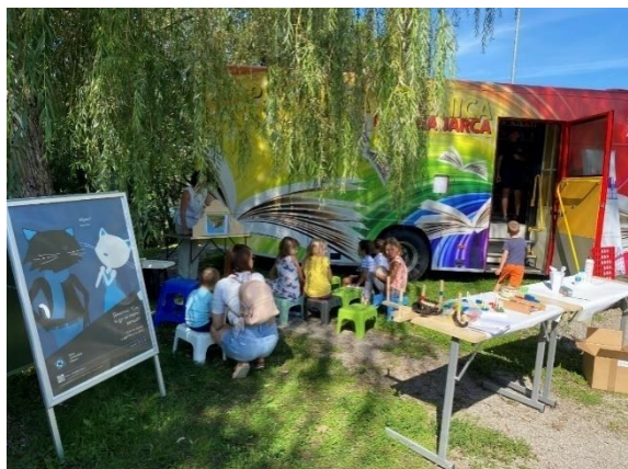
Slika 42: Predstavitel bibliobusa na Festivalu mladih v Novem mestu