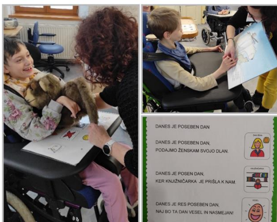
Slika 5: Izvedba ure pravljic v CUDV Draga, enota Novo mesto