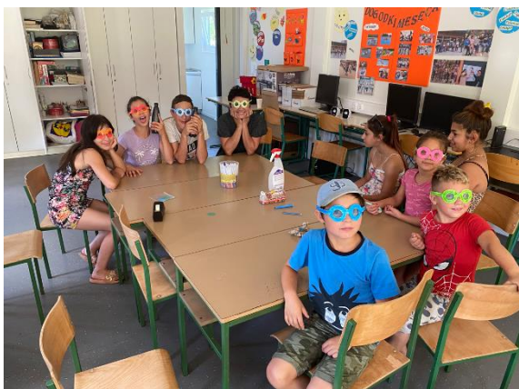
Slika 38: Branje knjige Kakšne barve je svet, avtorice Mojce Zupan Vrtač