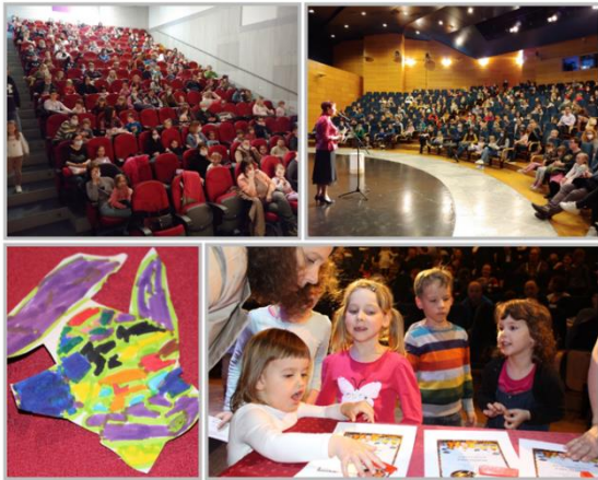
Slika 6: Zaključna prireditev Mavrična ribica v Kulturnem centru Janeza Trdine NM in Kulturnem domu Straža