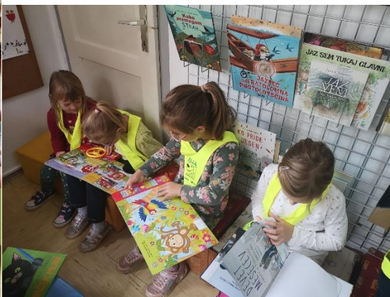
Slik1 10 in 11: Deklice prvega razreda si z zanimanjem ogledujejo slikanice