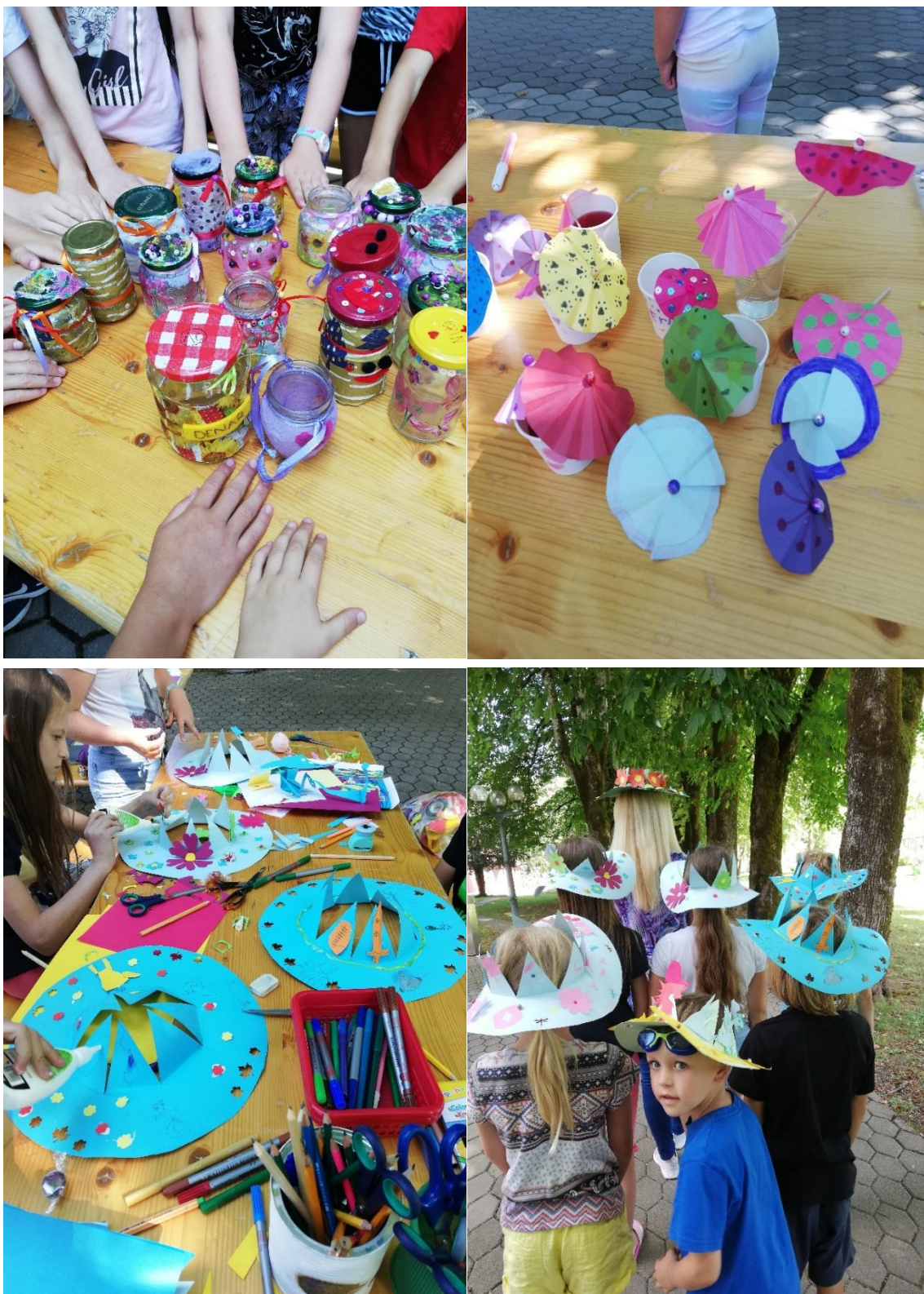
Slike 13–16: Utrinki s poletnih ustvarjalnih delavnic v zdraviliškem parku; krasili smo kozarčke s poletnimi motivi, izdelovali igrive dežničke za osvežilne pijače in barvite poletne klobuke.