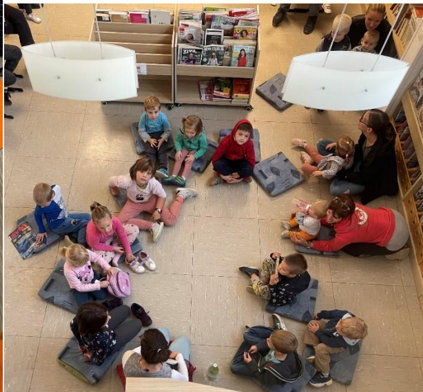
Sliki 23 in 24: Pravljična urica z ustvarjalno delavnico