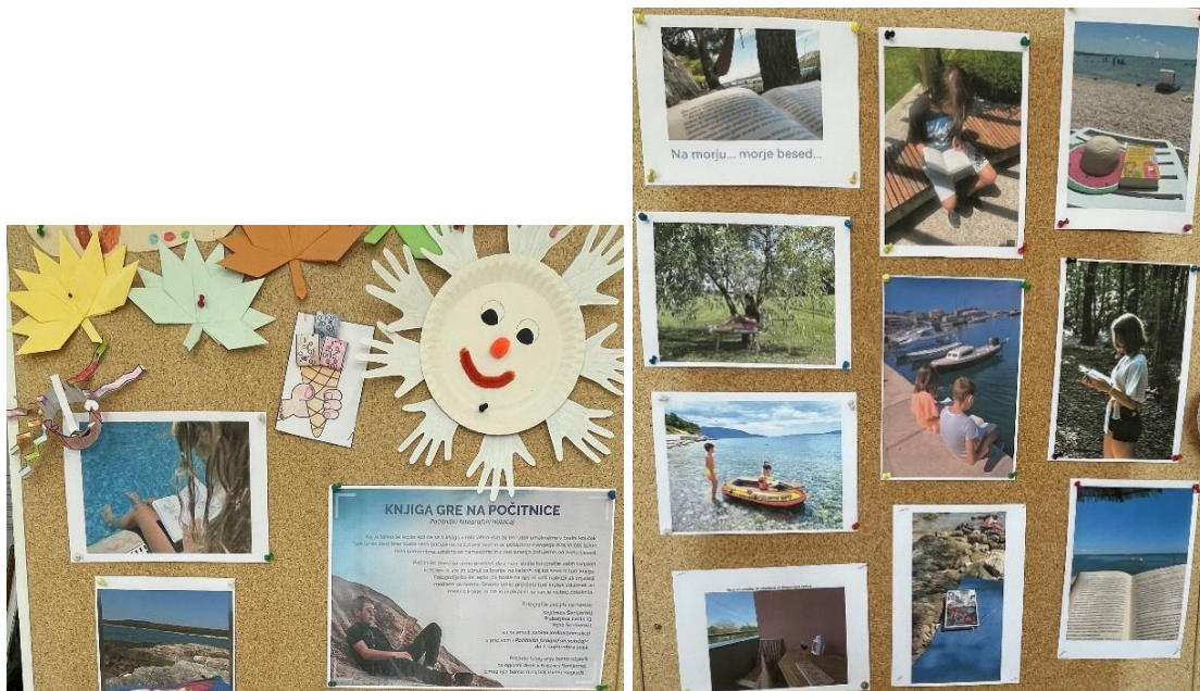
Slike 18 in 19: Počitniški fotografski natečaj Knjiga gre na počitnice